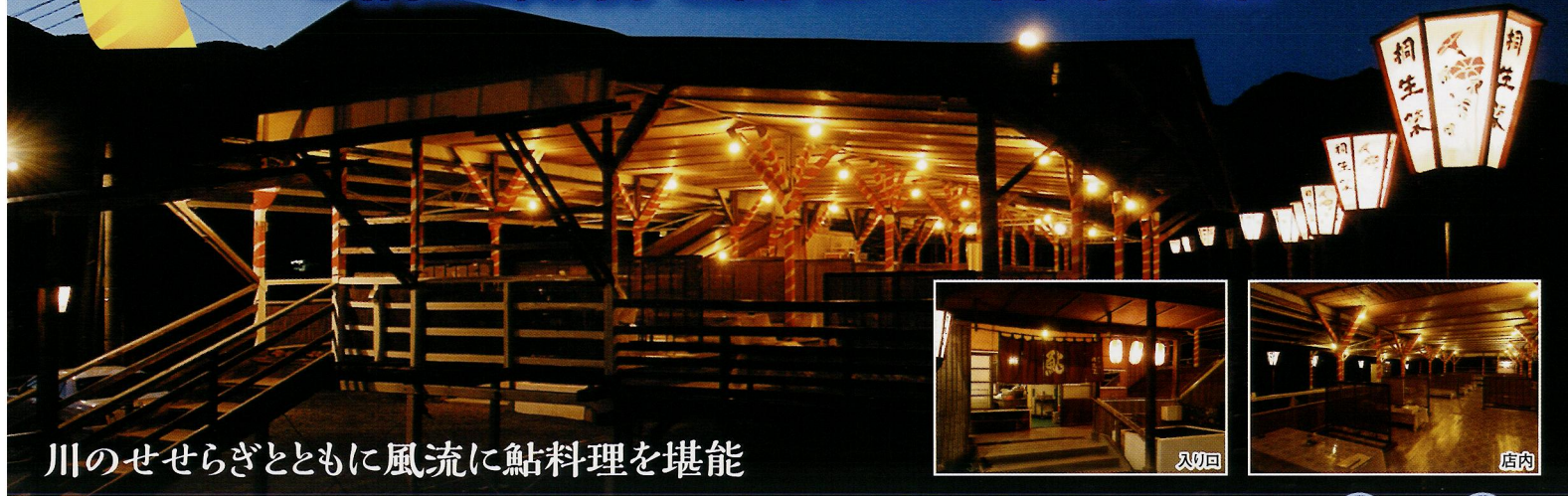
川のせせらぎとともに風流に鮎料理を堪能